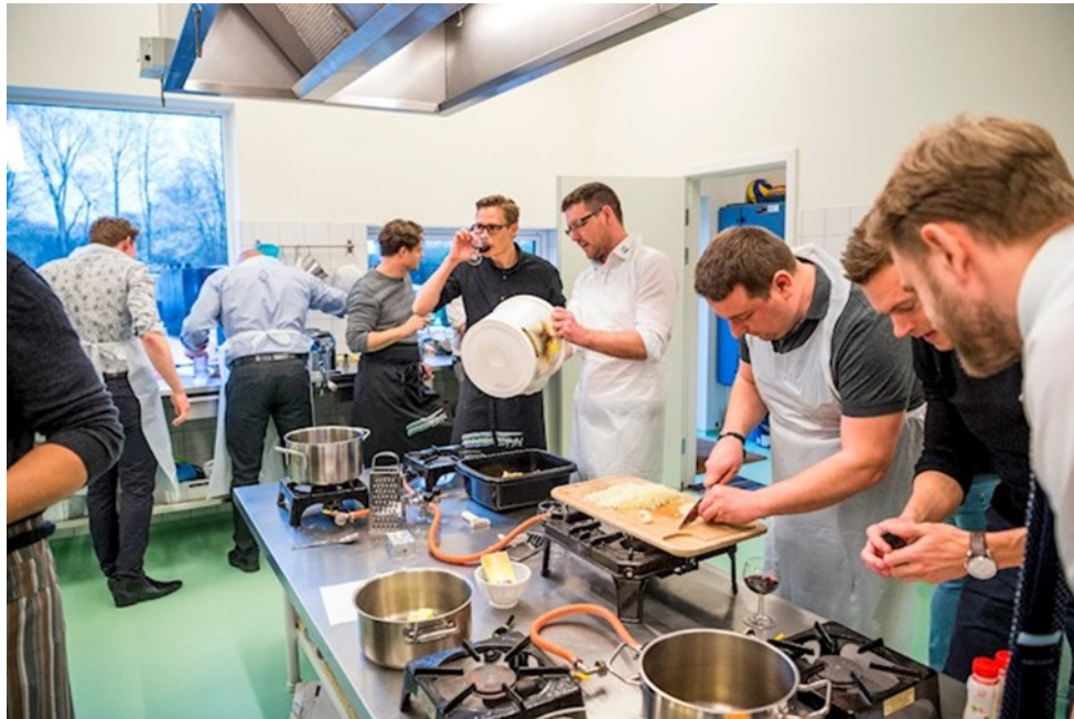
MÆND PÅ KURSUS