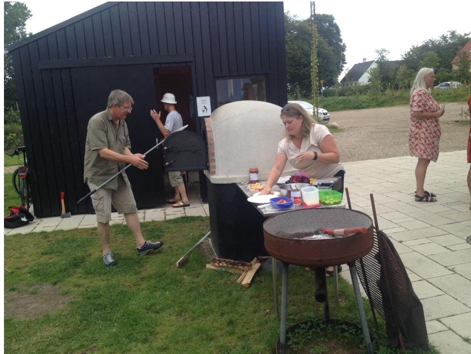
NABOKLUB HOLDER PIZZAPARTY