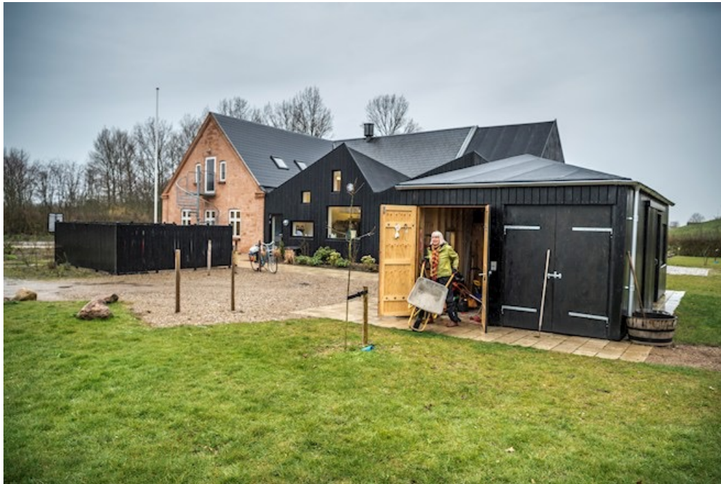
DEN NYE BAGSIDE