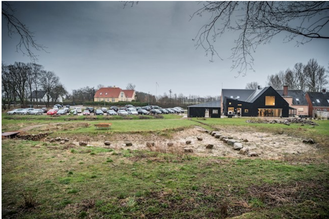
P. PLADS, MADPAKKEHUS