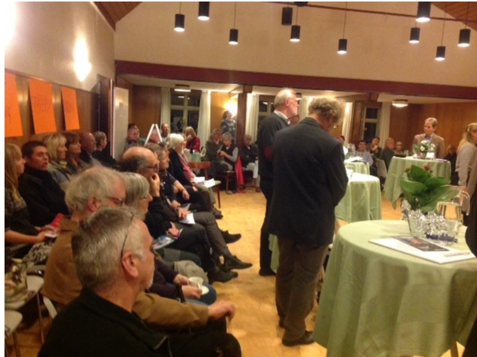
GL SAL, VALGDEBAT