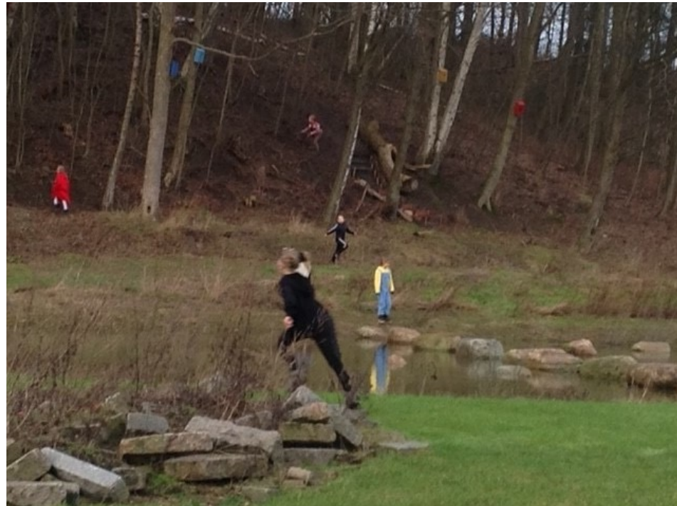
STEN MED STOR TILTRÆKNING